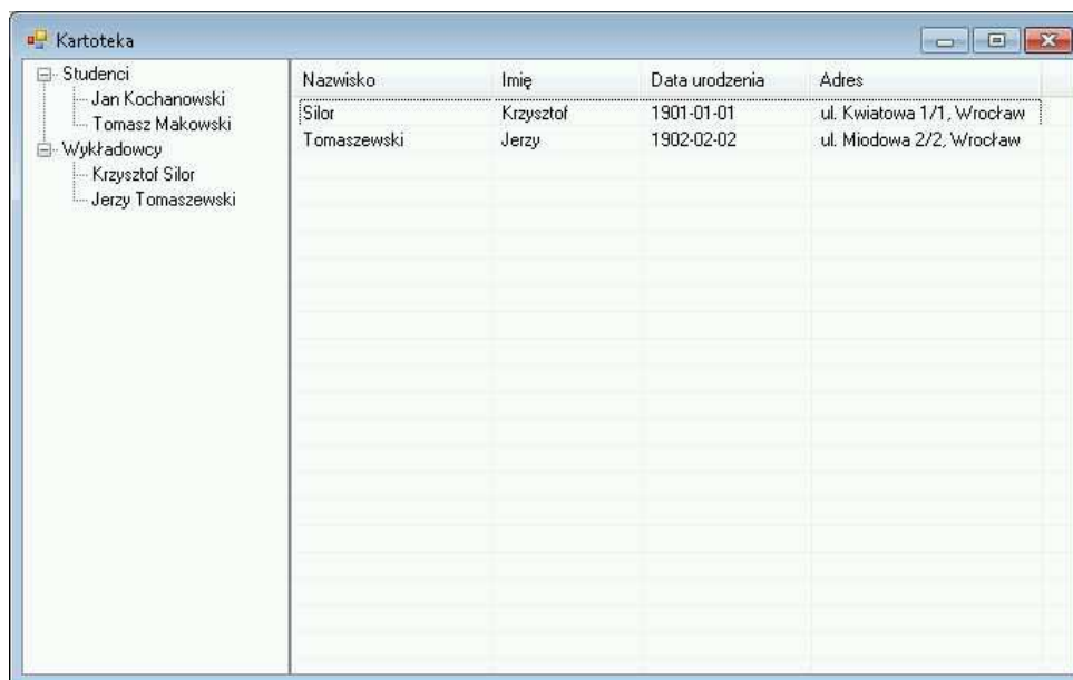
Rysunek 1: Rysunek do zadania 1